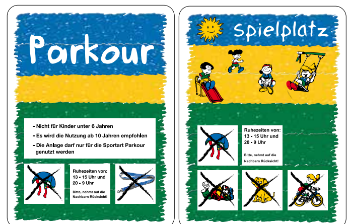
Die neuen Hinweisschilder auf der Grünen Mitte