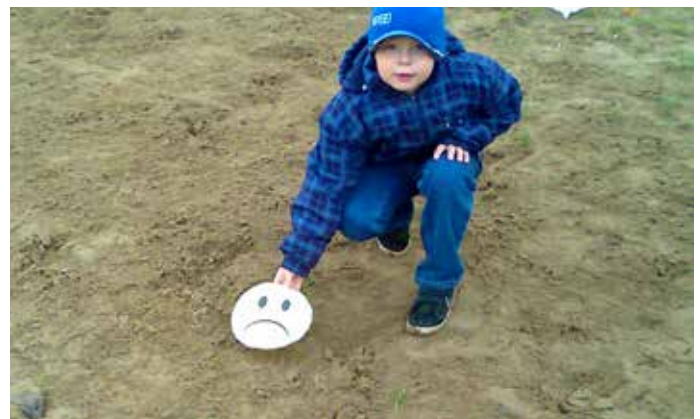
Unter dem Basketballkorb soll fester Boden sein!