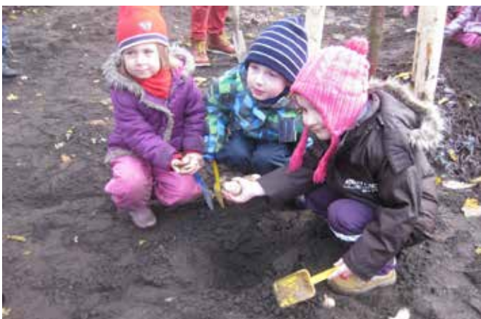
Die Kitakinder pflanzen Blumenzwiebeln

Im Rahmen des kompletten Beteiligungsverfahrens wurde deutlich, dass sich die Mastbrooker eine Grüne Mitte wünschen, die durch attraktive Gestaltung und gute Nutzungsangebote insbesondere auch positiv zum Image des Stadtteils beiträgt. Sie erwarten, dass die gewünschte neue Anlage durch Pflege dauerhaft in gutem Zustand gehalten wird. Das bedeutet jedoch auch, dass alle Kinder-, Jugendlichen- und Erwachsenen nun mit Verantwortung übernehmen müssen, damit die Grüne Mitte lange in ihrem Glanz erstrahlt und sauber bleibt.