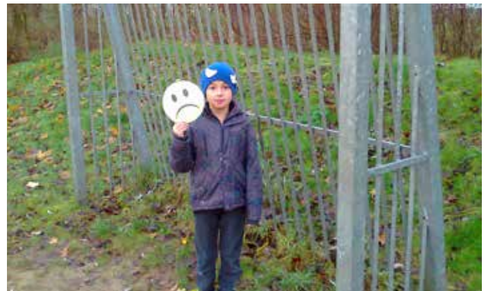
Ein Fußballtor braucht richtige Netze!