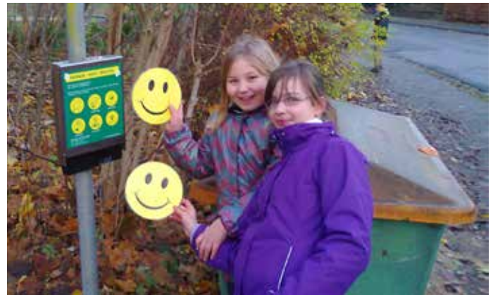
Der Platz soll sauber bleiben!

Um die in Mastbrook lebenden Kinder, Jugendlichen und Erwachsenen am Planungsprozess zu beteiligen, fanden im November 2012 unter der Leitung des Planungsbüros Kessler und Krämer und unter der Mitwirkung der BIG-STÄDTEBAU GmbH in der Schule Mastbrook zwei Ideenworkshops statt. In getrennten Workshops tauschten sich Kinder, Jugendliche und Erwachsene über Ihre Erwartungen an die Stadtteilsanierung und die Parkgestaltung aus. Es wurde munter diskutiert, gebastelt, gemalt und Ideen, Wünsche und Interessen für ein Neukonzept der Grünen Mitte gesammelt. Ein zentrales Anliegen war hierbei, einen schönen Ort für alle Generationen zu schaffen.