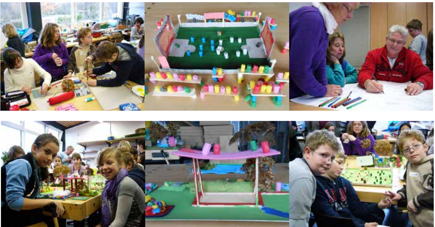
Oben und Unten: So wünschen wir Mastbrooker uns die Grüne Mitte. Es wurde geplant und gebastelt.

Die Workshopergebnisse bildeten eine wesentliche Grundlage für die Entwicklung der Entwurfsplanungen. Nach der Vorstellung und Bestätigung des Entwurfs zur Grünen Mitte im Sozial- bzw. Bauausschuss der Stadt Rendsburg wurde über den Planungsstand und die Inhalte auch im Stadtteil informiert. Das Quartiersnetzwerk Mastbrook wurde regelmäßig beteiligt. Zusätzlich berichtete die Stadtteilzeitung Mastbrook in insgesamt 3 Ausgaben zu diesem Thema und der erarbeitete Planungsvorschlag hing im Stadtteilbüro zur Information aus. Auch das Quartiersnetzwerk Mastbrook hatte die Grüne Mitte regelmäßig auf der Tagesordnung stehen. Weiterhin wurde die Planung mit Kindern der 3. und 4. Grundschulklasse besprochen und auch im Jugendzentrum diskutiert.