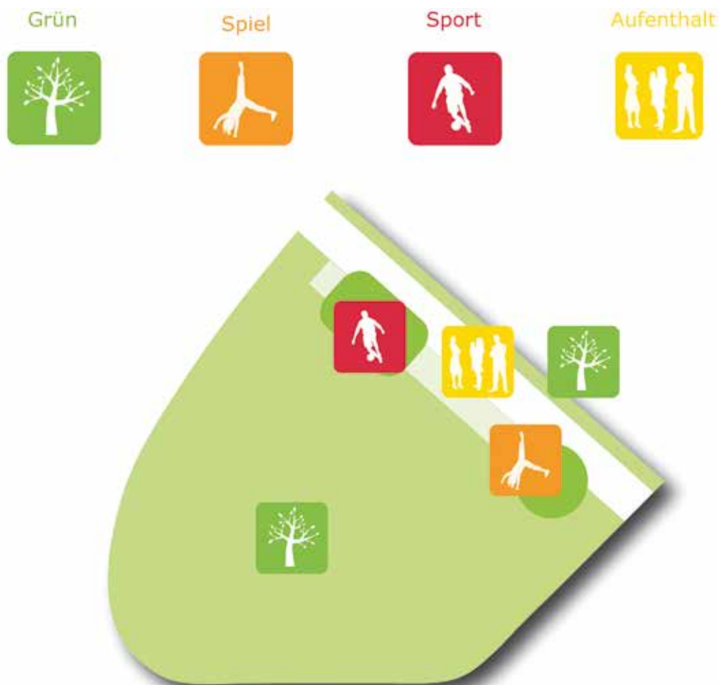
Abb. 1: Raum- und Funktionskonzept der Grünen Mitte

angrenzend, befindet sich der Aufenthalts- und Spielbereich . Dieser Abschnitt lässt sich wiederum in zwei Teilbereiche unterscheiden. Zum einen besteht er aus einer ca. 7 Meter breiten Promenade, die an den Spazierweg anschließt und der Erschließung der Grünen Mitte dient. Die Promenade lädt mit ihren Bänken und Bank-Tisch-Kombinationen sowie den überdachten Sitzgelegenheiten zum Verweilen ein und bietet einen idealen Ort der Begegnung und Kommunikation für die Quartiersbewohner.