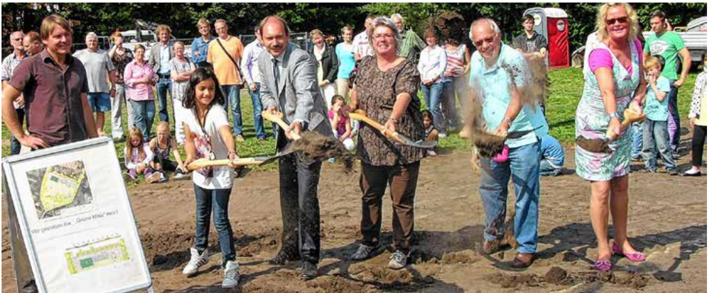
Der erste Spatenstich

Mit dem Spatenstich am 28. August 2013 begann die Bauphase. Die Kinder der benachbarten Kita Villa Kunterbunt beteiligten sich tatkräftig an der Verschönerung der Grünen Mitte. Im Herbst des vergangenen Jahres griffen sie zur Schaufel und gestalteten die Grüne Mitte aktiv mit. Das Ergebnis war in diesem Frühjahr in Form von vielen bunten Blumen zu sehen. Die Jugendlichen aus dem Stadtteilhaus bereiten sich derzeit darauf vor, ihre eigene Holzbank auf der Grünen Mitte zu streichen. Auch das Eröffnungsfest am 27. Juni wird nicht dem Zufall überlassen. Mehrere engagierte Mastbrooker haben sich zu einem Festausschuss zusammen getan, damit an diesem Tag auch alles nach dem