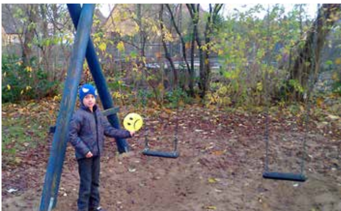
Eine neue Schaukel soll her!